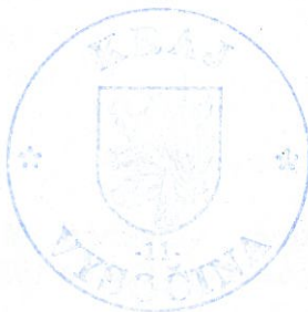
Miloš Vystrčil hejtman kraje