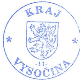
Miloš Vystrčil hejtman kraje