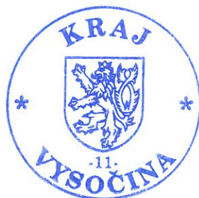
Miloš Vystrčil hejtman kraje