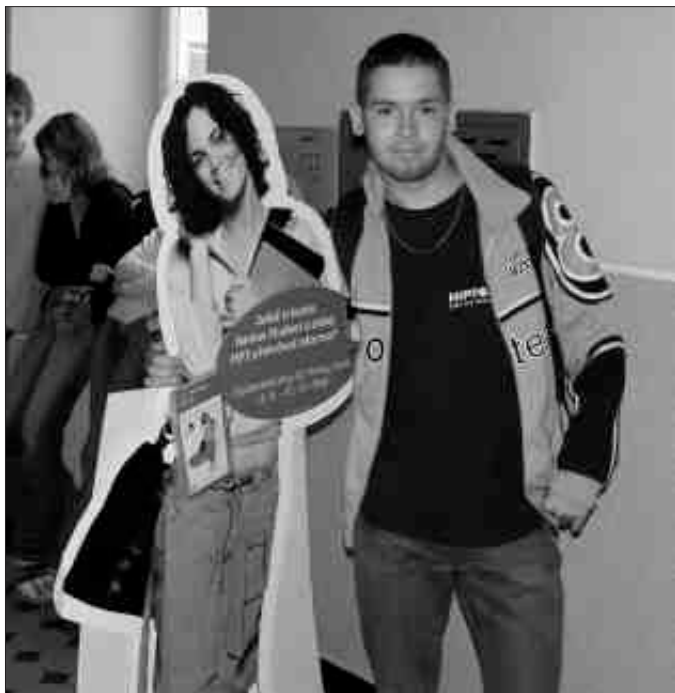
S Kačkou už se zasnoubili, ale má být reklama na bankovní účet ve škole? Ustlala si na skřítnkách.