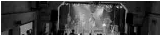
Markéta Cikrytová, 3.B

Jak jste si již mohli všimnout na plakátech ve městě visících či letáčcích na okně gymnázia ležících, blíží se další ročník multikulturního hudebního festivalu Bigbíťový Křídla.